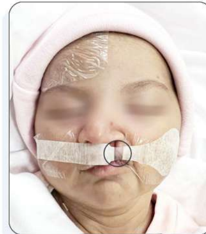
اللصقة تغطي الشق بالكامل