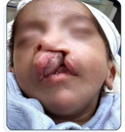
قبل وضع اللصقات