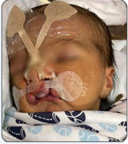
بعد وضع اللصقات