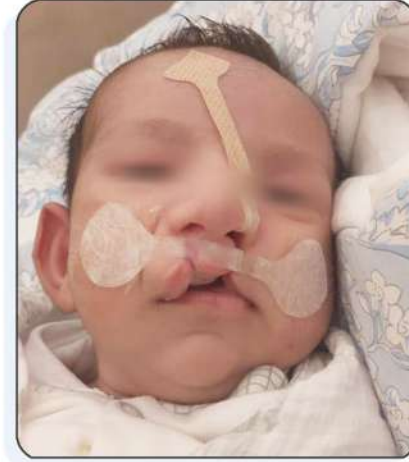
بعد وضع اللصقات