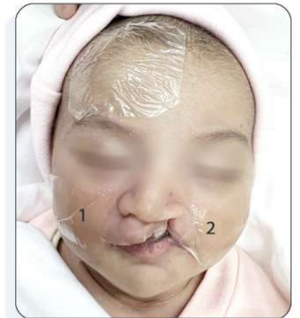
لصقات حماية على الخدين