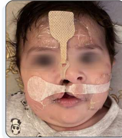
بعد شهرين من وضع اللصقات