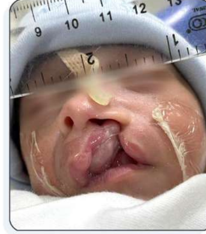
بعد أسبوع من وضع اللصقات (يمكن ملاحظة ارتفاع الأنف)