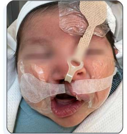
وضع اللصقات خلال الأسبوع الأول